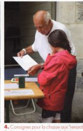
4. Consignes pour la chasse aux "membres" (balises radio) dans la cour du fort.

soirée d'observation du samedi sur la terrasse, habituellement noire de monde, a été annulée en raison des orages... Un contretemps toutefois mis à profit par quelques photographes pour chasser les éclairs ! La sixième édition du week-end des étoiles a donc été une fois de plus une réussite, et le Club Orion du Pays de Gex vous donne d'ores et déjà rendez-vous à l'été 2017.