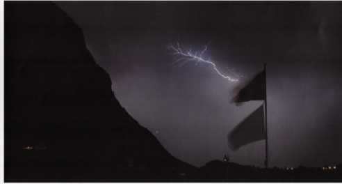
5. Au lieu des étoiles, ce sont les éclairs qui ont fait le spectacle samedi soir depuis la terrasse.

Astrosurf-Magazine N°82 - Sept./Oct. 2016