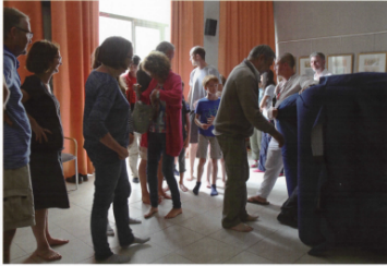
2. Les séances de planétarium gonflable, valeur sûre pour attirer le grand public !

62 Astrosurf-Magazine N°82 - Sept./Oct. 2016