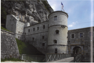
1. L'imposante maçonnerie de Fort l'Ecluse marque l'entrée dans le pays de Gex.

Le Club Orion du Pays de Gex dédié depuis six ans un grand week-end estival à notre loisir dans un magnifique lieu touristique situé dans l'Ain : Fort l'Ecluse, à quelques kilomètres de la frontière suisse. Cet édifice fortifié surplombant le Rhône, au passé chargé d'histoire, est un cadre magnifique pour initier les néophytes et se rencontrer entre passionnés. Cette année encore, plusieurs clubs des environs (français et suisses) ainsi que des radioamateurs s'y sont retrouvés durant deux jours, les 30 et 31 juillet. Ils ont proposé des animations variées à un public souvent familial que le temps orageux n'a pas découragé, puisque plus de 800 personnes ont franchi l'enceinte. Eparpillés dans tout le fort, un parcours d'initiation radioamateur (localisation de balises, apprentissage du morse, etc.), des maquettes du système solaire et du couple Terre-Soleil, un atelier de cadrans solaires, un planétarium gonflable, des conférences, une exposition sur les aurores polaires, des observations de notre étoile aux instruments et des stands associatifs et commerciaux s'offraient ainsi aux visiteurs en complément de la visite du fort. Seule la